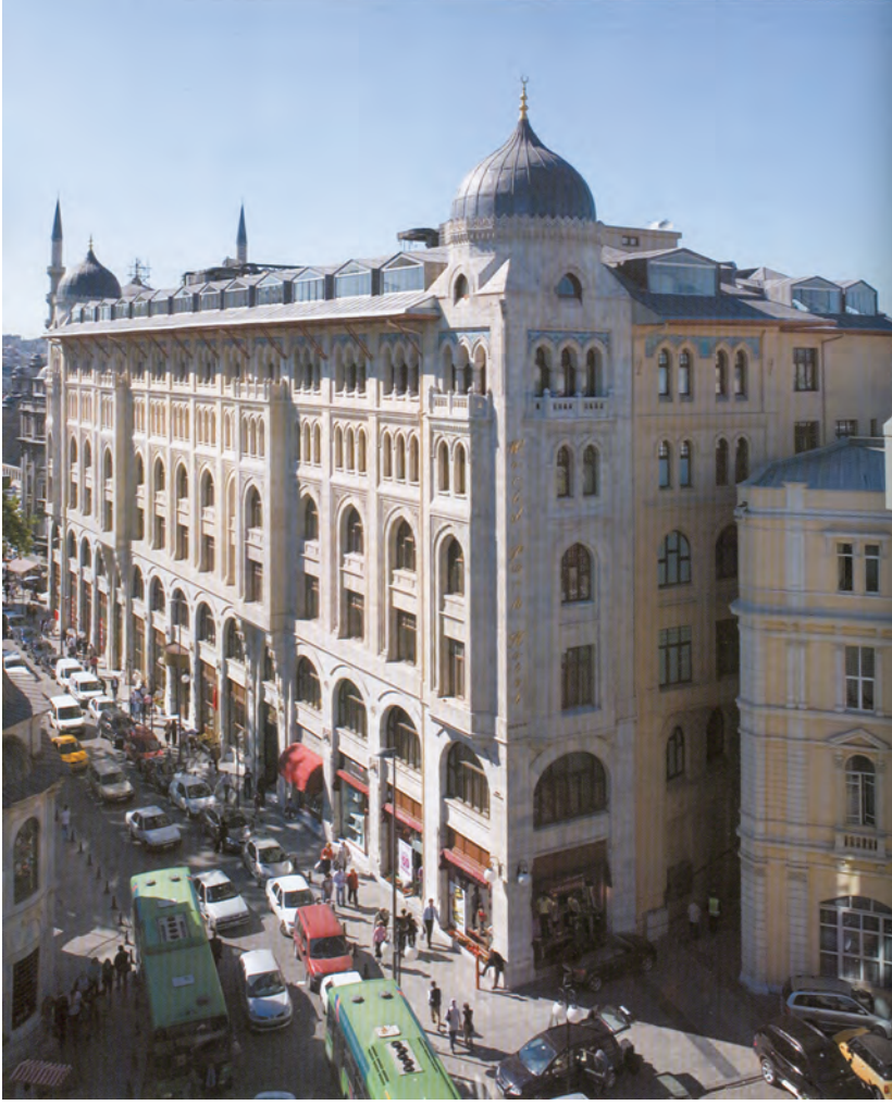
Dördüncü Vakıf Hanı otele dönüştürüldükten sonra

binaların onarımına, ticari hanlardan okul ve hastanelere kadar uzanan mimari kategorileri içinde çalışmış. Coğrafya açısından, eserleri Filibe'den Medine'ye kadar uzanan bir bölgede bulunuyor. Teknoloji açısından, şimdi Çamlıca Lisesi olarak bilinen, ahşap iskeletli Ratip Paşa Konağı, kesme taş ya da tuğla yığma binalar, taşıyıcı duvar ile demir kat döşemeleri olan karışık strüktürler, taşla kaplı çelik iskeletli binalar ve 1922 Harikzedegân projesinden itibaren betonarme kullanımına rastlıyoruz. Kanımca, üslup ve biçim açısından da bu eserler çok katı bir "ulusal" çerçeveye sınırlı değilmiş: Örneğin Çukurcuma'da bulunan ve 1911'de tasarlanan Üçüncü Vakıf Han apartmanında, muhtemelen Kemalettin'in çevreye gösterdiği duyarlık yüzünden, klasik Osmanlı dekoratif öğelerinden vazgeçiliyor, bölgedeki Levanten apartmanların