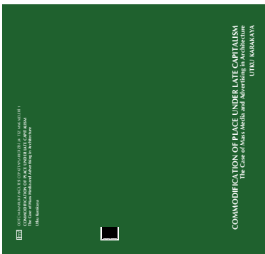
UTKU KARAKAYA COMMODIFICATION OF PLACE UNDER LATE CAPITALISM: THE CASE OF MASS MEDIA AND ADVERTISING IN ARCHITECTURE

mobilya ve her tür form tasarımına uyguluyorlardı.”