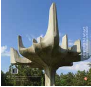
ODTÜ DEĞERLERİ CEP DİZİSİ ODTÜ BİLİM AĞACI