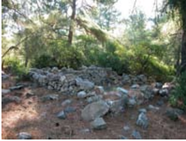
Resim 2. Zindaf Kale, Geç Antik Köy

yazılı kaynaklara bakacak olursak, bu terimlerin kullanım ve tanımı, farklı bölgelere ve zaman dilimlerine göre değişiklik gösterebildiği gibi, aynı terim aynı döneme ait farklı kaynaklarda farklı yerleşim türlerine referans verecek şekilde de kullanılabilirdi (20). Bunlara, Zadora-Rio'nun, Le village des historiens et le village des archéologues başlıklı çarpıcı makalesinde de vurguladığı gibi (1995, 147-148), yazılı kaynaklarda bahsedilen çeşitli yerleşim birimlerini arkeolojik verilerle doğrudan ilişkilendirebilmenin ve hatta ekonomik anlamda organize olmuş bir kırsal topluluğun varlığı ve başka diğer fonksiyonlarıyla 'köy' olarak tanımlanabilecek yerleşimlere ait arkeolojik verilerin yokluğunu da eklemek gerekir (21). Yanıltıcı anlamlara veya yorumlara yol açmamak için bu çalışmada 'köy', Laiou'nun (2005) temel tanımını esas alarak 'kendi toprağına ve ekonomik mekanına sahip kırsal bir topluluğu barındıran yerleşim yeri' olarak tanımlanmaktadır.