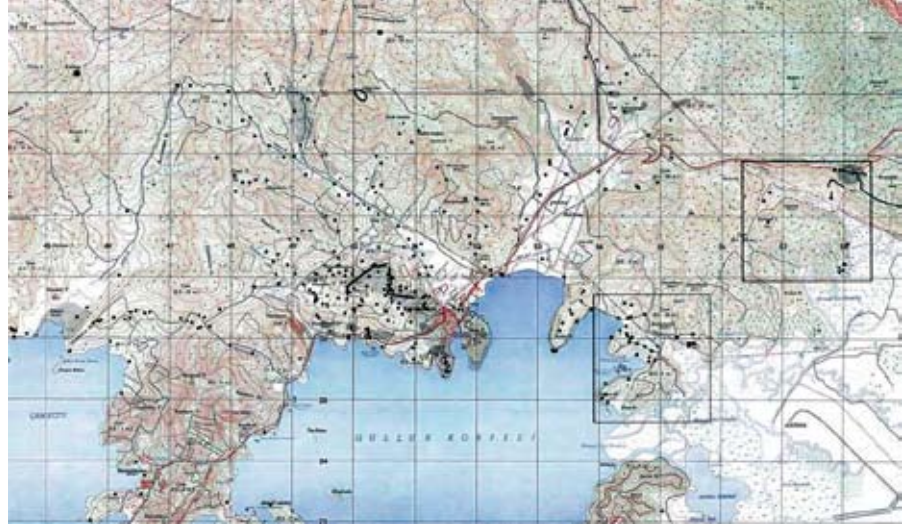
Resim 1. Karya, Mandalya Körfezi Arkeolojik Yüzey Araştırması Alanı. AYDIN N19-a3-4 haritası üzerinde G. Marchand tarafından geliştirilmiştir (Mandalya Körfezi Arkeolojik Yüzey Araştırması Arşivi; Pierobon, 2011)