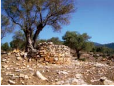
Resim 6. Mandalya Körfezi, bir kiliseye ait kalıntılar (Mandalya Körfezi Arkeolojik Yüzey Araştırması Arşivi)

(Hirschfeld, 2005, 531) ( Resim 5 ). Yunanistan'da yakın geçmişte yapılan arkeolojik araştırmalar da Geç Antik dönemde (özellikle M.S. 400-650 arasında) neredeyse Klasik dönemle karşılaştırılabilir düzeyde yoğun ve zengin kırsal yerleşimlerin varlığını ortaya koymuştur (Bintliff, 1995, 606-608). IV. ve V. yüzyıllardaki ekonomik gelişmeye bağlı olarak artan bu kırsal zenginliği, Avi-Yonah (1958) ve Mayerson (1982; 1994) gibi bazı araştırmacılar Kilise'nin rolüne ve bununla birlikte İmparator I. Constantinus'un yapı faaliyetine bağlamaktadır. Bu faktörler özellikle Kutsal Topraklar olarak bilinen coğrafya başta olmak üzere bazı bölgeler için geçerli olmakla birlikte, kuşkusuz IV. ve V. yüzyıl imparatorlarıncı yapılan ve imparatorluk mülküne ait arazileri tarım amaçlı olarak kullanmayı talep eden herkese söz konusu arazilerin özel mülkiyetini veren ve agri deserti olarak bilinen yasal düzenlemelerin (Cod.Theod. 5,14,30; Cod.Iust. 11,58,7) bu kırsal zenginlikte önemli rolü olduğu yadsınmaz (28).