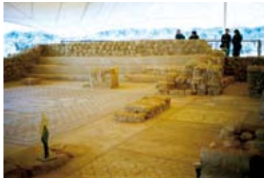
Resim 5. Ein-Gedi, Geç Antik Köy, mozaikli ev

Zindaf Kale'deki Geç Antik köy birbirine yakın yerleştirilmiş oturma birimleriyle Bizans İmparatorluğu sınırları içerisinde bir çok bölgede yaygın olarak görülen kırsal yerleşim modelini yansıtmaktadır (Harrison, 2003; Hirschfeld, 2005). Çok tipik bir örnek Kudüs'ün kuzeydoğusunda Khirbet et-Tinat'da bulunan avlulu, üç odalı ve dikdörtgen planlı köy evidir (Hirschfeld, 1997, 49-50) ( Resim 3 ). Nitekim bir avluya açılan iki, üç veya dört odadan oluşan dikdörtgen planlı yapılar Bizans döneminin tipik kırsal yaşam birimini oluşturmaktadır (Hirschfeld, 1997, 55; Rautman, 2006, 167) ve arkeolojik veriler bu kırsal oturma birimlerinin VII. ve VIII. yüzyıllara kadar kullanılmış olduğunu göstermektedir (Haiman, 1995; Hirschfeld, 2005). Tipik mimari öğeleriyle oldukça iyi korunmuş bir Bizans köyü Batı Samarya'da Horvat Zikhrin'de bulunmaktadır ( Resim 4 ). Bu köyde sekiz-dokuz oturma birimi, köyün merkezinde bir kilise, ufak bir hamam, çok sayıda sarnıç ve çevrede nekropol alanları bulunmaktadır (Fischer, 1993, 40-44; Hirschfeld, 1997, 47). Benzer örnekler Suriye sınırından Karadeniz'in kuzey kıyılarına kadar uzanan çok geniş bir coğrafyada da görülebilir (Ariabin, 2005; Saanov, 2005; Rousset ve Duvette, 2005).