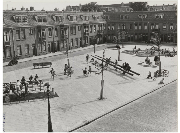
Resim 7, Resim 8. Transvaalplein oyun alanı, öncesi ve sonrası.

Eyck; 1947 ile 1970 yılları arasında, hemen her mahalledeki boş arazilere yahut unutulmuş alanlara, boş yer olmayan mahallelerde ise İkinci Dünya Savaşı sırasında tehcir edilen insanların evleri yıkılınca boşalan arsalar ve artık alanlara 700'den fazla oyun alanı tasarlar (van Eyck, 1999, 68, 70) ( Resim 3 - Resim 8 ). Bu oyun alanlarını tasarlarırken, bir katalogdan alüminyum fil veya zürafa gibi oyun alanı ekipmanlarını seçmek yerine çocukların üzerine veya altına oturabileceği ve çeşitli biçimlerde kullanabileceği kubbe, iglo veya kemer gibi şekilleri kullanır (van Eyck, 2008, 115). Çocuklara bu tür ekipmanları deneyimleme fırsatı yaratarak çocukların eylemleri aracılığıyla mekâna katılım sağlamalarını ve mekanı yere dönüştürmelerini sağlar. Oyun alanları sadece çocuklar tarafından değil aynı zamanda gençler ve yetişkinler tarafından da kullanılabilirdiği için farklı yaş grubundan insanları bir araya getirerek kutuplara bir zemin sağlayan ve herkes için yer sağlayan ara alan olarak görev yaparlar.