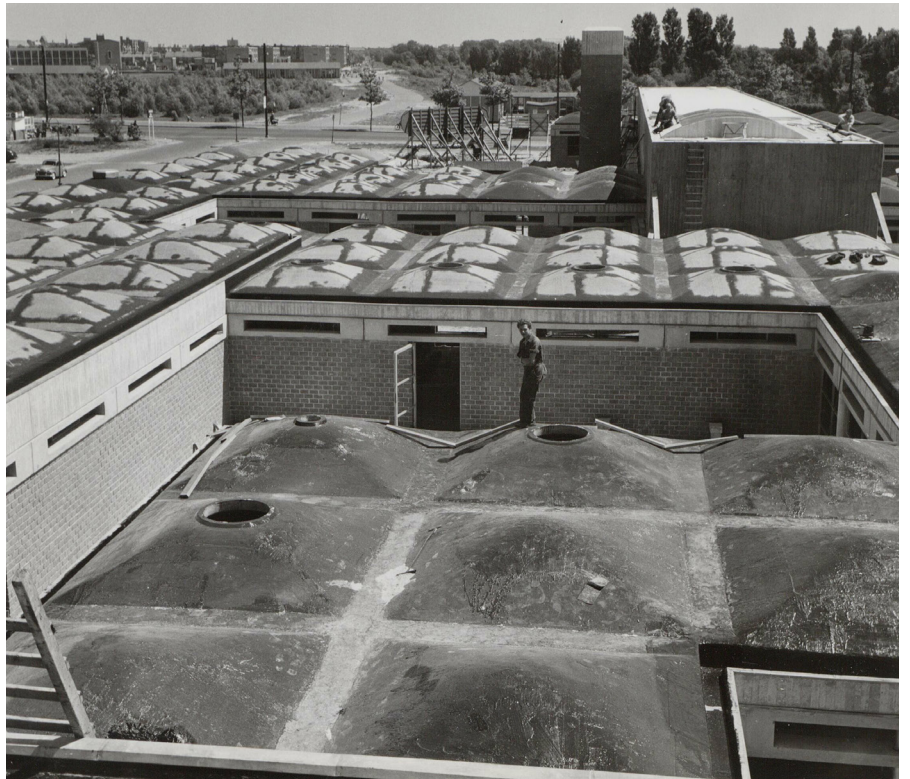
Resim 15. Amsterdam Yetimhanesi'nin kubbeleri.

Van Eyck'in geliştirdiği ara alan kavramının gözden geçirilmesinden ortaya çıkan en önemli bulgulardan birisi, ara alanın, yalnızca insanlar arasında