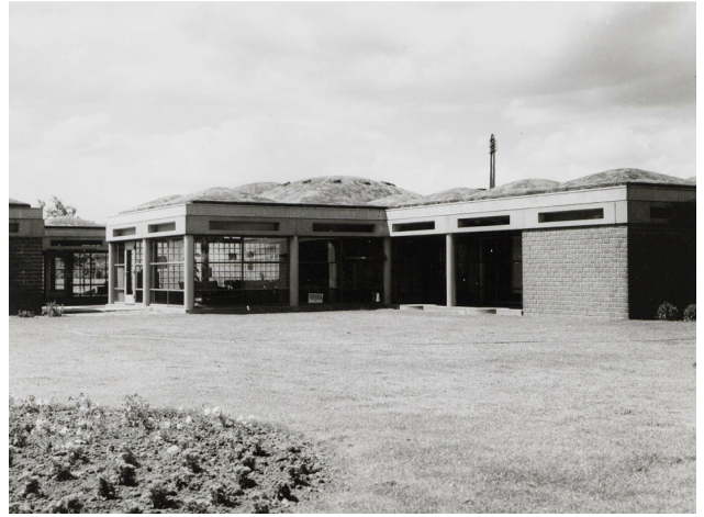
Resim 9, Resim 10, Resim 11, Resim 12. Amsterdam Yetimhanesi.

malzemelerle ve sokak aydınlatmasıyla üzerinde çatısı olan bir sokak olarak tasarlanır (van Eyck, 1962/1999, 89).