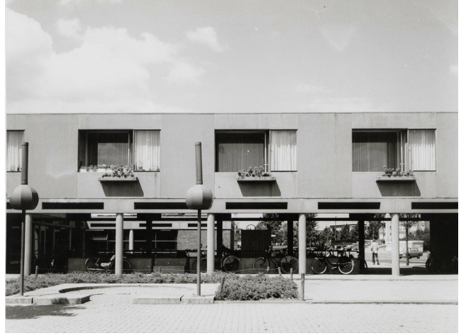
Resim 13, Resim 14. Amsterdam Yetimhanesi açık meydanı ara alan olarak tasarlanmıştır.

kurabileceği, uzlaşabileceği ve ikiz fenomen haline gelebileceği ortak bir zemin sağlar.