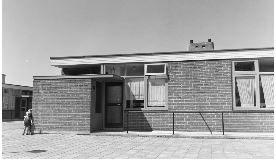
Resim 2. Van Eyck ile Jan Rietveld'in yaşlılar için tasarladıkları evlerin ( The Houses for the Elderly ) önlerindeki trabzanlar yer örneği teşkil eder (Stadsarchief Amsterdam, arşiv kayıt no: 5293FO006211).

Van Eyck'in mimari düşüncesinde; insanın mekândaki varlığı, deneyimi ve etkinliği mekânı yere dönüştürür. Dolayısıyla insanın deneyimi esastır ve insanın katılımı değerli kabul edilir. Burada belirtmek gerekir ki mekân ve yer arasındaki ayırım 1960'ların başında yaygın değildir; ancak "van Eyck bunları altmışlı yılların ortalarında geliştirdikten kısa bir süre sonra mimari düşüncenin ticari sermayesinin bir parçası haline gelmiştir" (Strauven, 1998, 471).