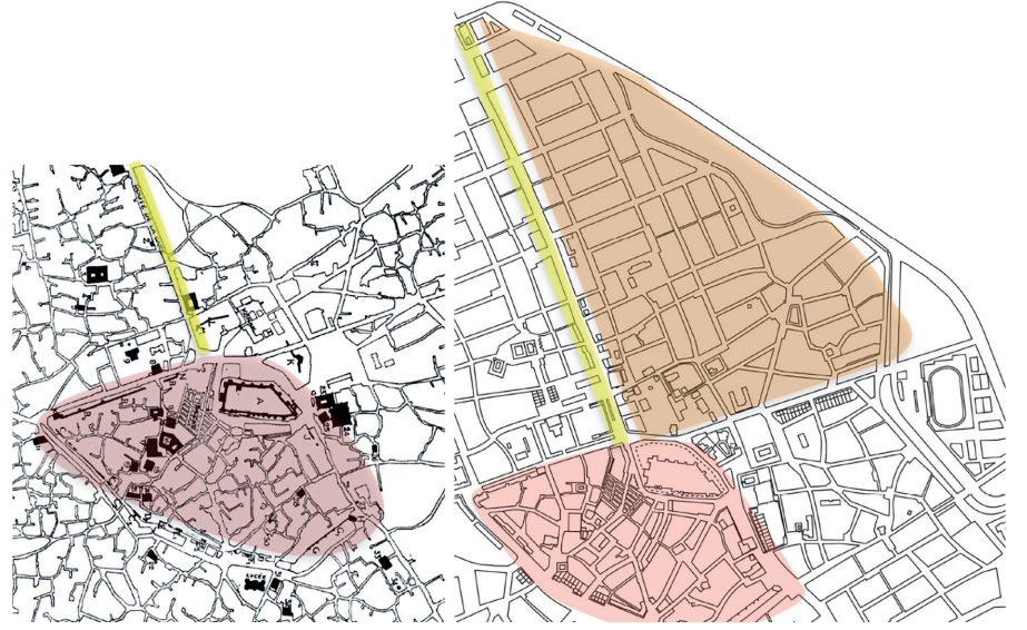
Resim 9. Sur-içi (kırmızı leke) - İstasyon Caddesi (sarı leke): (solda) 1926 Gabriel (1954) haritası ve (sağda) 1945 Oelsner-Aru 1/5000 paftası (Ovacık Çoruh, 2018)

Mahallesi bu imgenin en önemli bileşenleridir ( Resim 2-9 ). İstasyon Caddesi'nin kamu yapıları ve çok katlı bitişik nizam apartman bloklarının sınırladığı Sahabiye, planın önerisiyle tanımlanmış bir ızgara dokudur. Yollar, standart parsel boyutları, bahçeli konut tiplerinin tekrarıyla bu yerleşim, dönemin gereksinimlerine yönelik form, malzeme, konstrüktif elemanlar gibi yeni üretim biçimlerini ortaya çıkarmıştır. Erken Cumhuriyet döneminin normatif değerlerini taşıyan bütünlüklü bir imgenin üretimiyle bu dönem, disiplinler araçların yönetsel iktidar aklıyla ele alındığı bir geçiş dönemi olarak tanımlanabilmektedir.