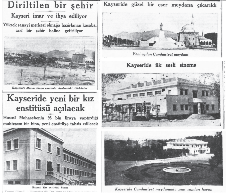
Resim 6. Cumhuriyet Gazetesi'nden içerikler (9.Nisan.1934; 6.Mart.1935, 14.Eylül.1935; 8.Eylül.1935; 31.Temmuz.1936)