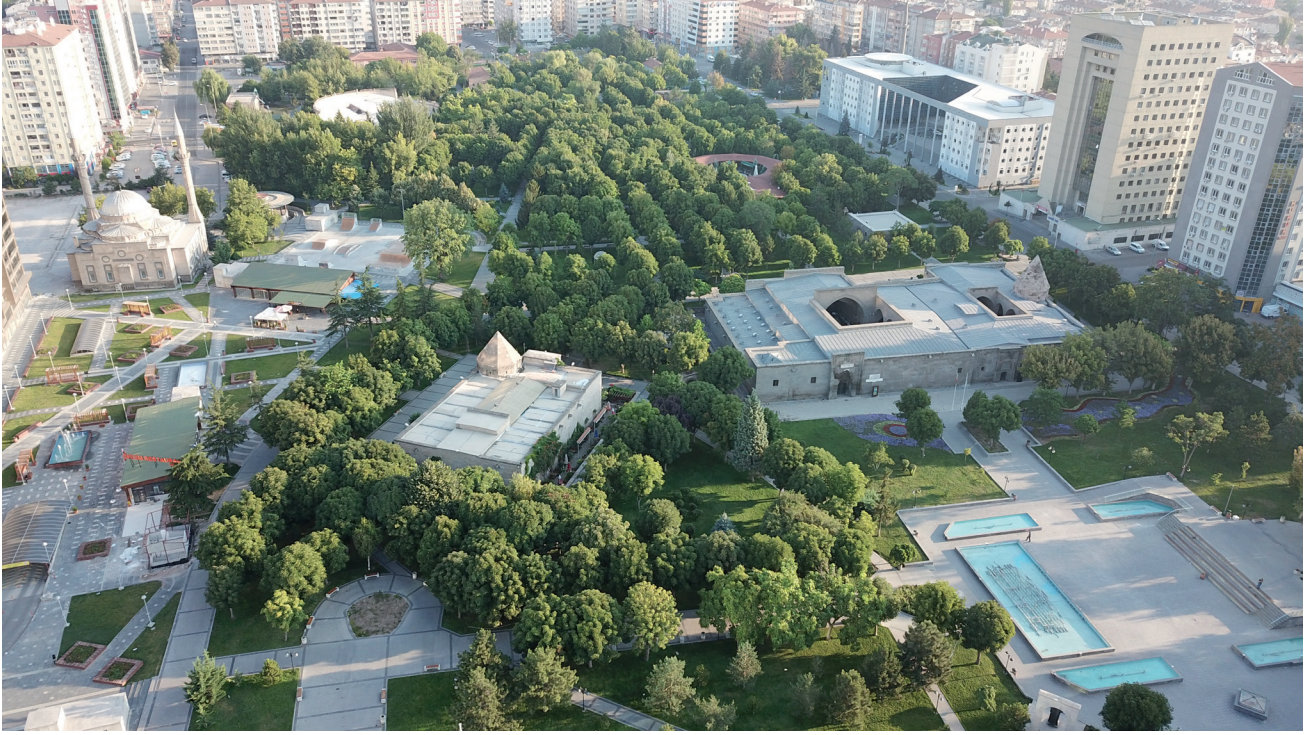
Resim 11. Mimar Sinan Parkı