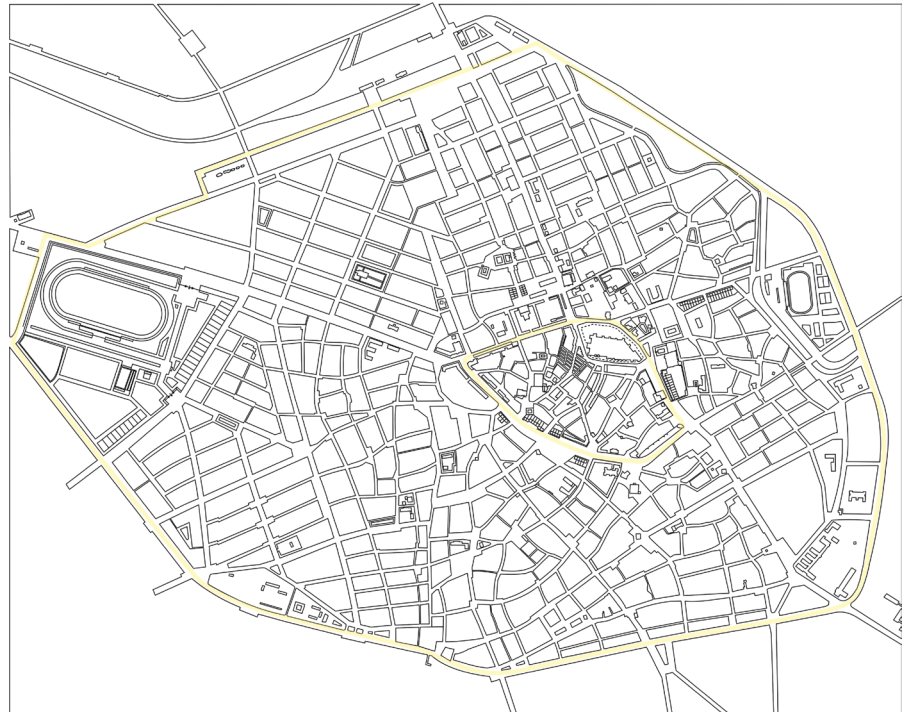
Resim 8. Oelsner-Aru Kayseri İmar Planı (1945, 1/5000 ölçekli paftadan yeniden üretim) (Ovacık Çoruh, 2018)