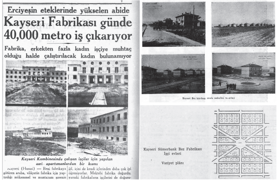
Resim 5. Gazete ve dergilerden içerikler (Uzel, 1936, 11 Mayıs; Mortaş, 1944, 11; Oran, 1956)

kalması, evleri yarı yıkık durumda bırakmıştır (Doğan, 2007,115-116). Her anlamda geri kalmışlığı temsil eden mevcut durumun üstesinden gelinmesi gerekliliği, eskiye karşı keskin bir eleştiriyi beraberinde getirmiştir. 1936-39 döneminin haberlerinde “eski ve biçimsiz evler” ve “daracık sokaklar” istimlak ve yıkımın haklı gerekçesi olarak konu edilmiş, ilerlemenin önünde duran bu tür bir engelden kurtulmaya yönelik değişim heyecanı dışa vurulmuştur (Cumhuriyet Gazetesi, 1936, 31 Temmuz). Yayımlanan toplantı raporlarında istimlaki gereken mahallelerin haritalarının yaptırıldığı belirtilmiş, Cumhuriyet öncesi “tarihi bir facia” olarak nitelendirilmiştir (Kayseri Gazetesi, 1931, 2 Teşrinisa; Cumhuriyet Gazetesi, 1934,16 Kasım).