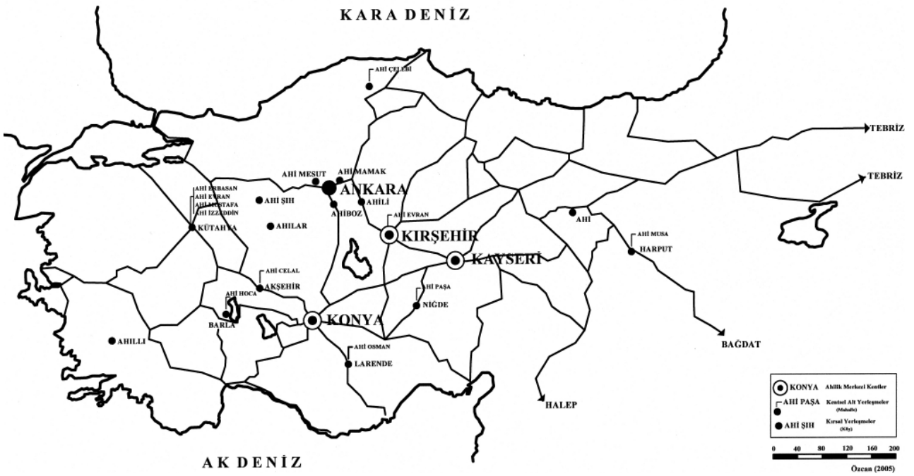
Harita 7. Anadolu'da Selçuklu dönemi inanç coğrafyası.