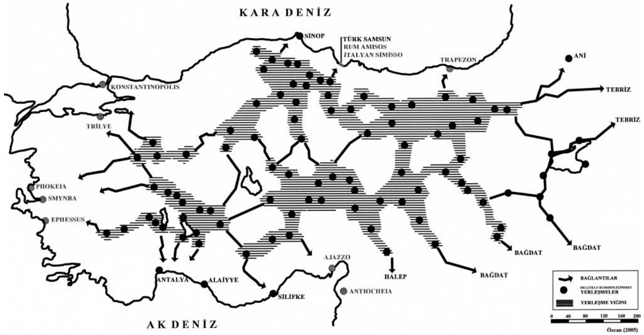
Harita 10. Anadolu'da Selçuklu kentler sistemi; kentsel yığılma bölgeleri-yerleşmeler zinciri.

Sultan Önu-Kütahya-Emirdağ-Karahisar-ı Sahip-Sivrihisar yörelerinde 200.000 ve Ankara'nın kuzeyindeki Karabuli denilen dağlık bölgede 30.000 çadırlık Türkmen kitlelerinin yığıldığını kaydetmektedir (Cahen, 1968, 42-48).