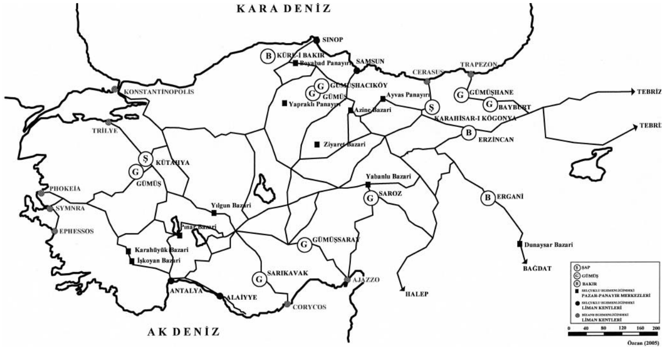
Harita 4. Anadolu'da Selçuklu dönemi üretim dağıtım merkezleri

Rubruck, 2001, 140). Dolayısıyla, Anadolu'da çıkarılan ve özellikle Avrupa ülkelerinde XIII. yüzyılda gelişmeye başlayan dokuma sektöründe boya maddesi olarak kullanılmasından dolayı özellikle Cenevizliler ve Floransalılar tarafından talep edilen şap kaynaklarına sahip olan yerleşmeler maden üretim–dağıtım merkezleri olarak önem kazanmıştır.