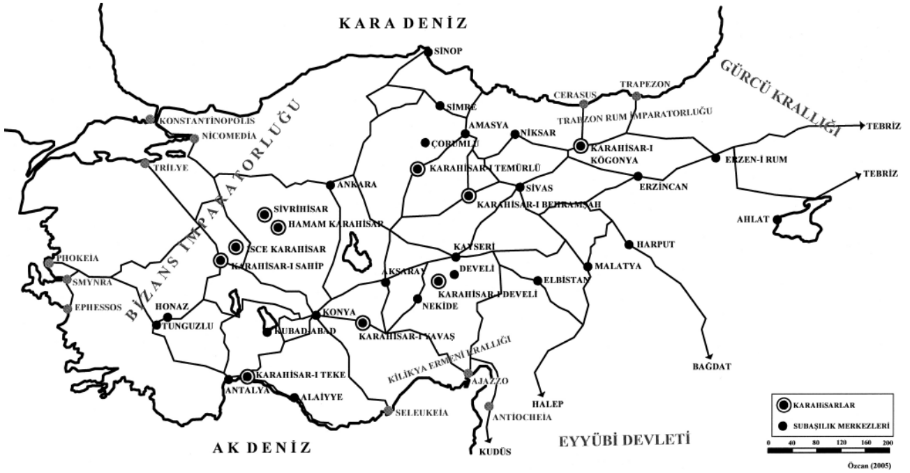
Harita 3. Anadolu'da Selçuklu dönemi savunma sistemi ve mekansal bileşenleri.

parçalarını oluşturabilecek altyapının var olduğunu düşündürmektedir (İmadeddin Al-İsfahâni, 1943, 56; Anonim Selçuk-Nâme, 1952, 25).