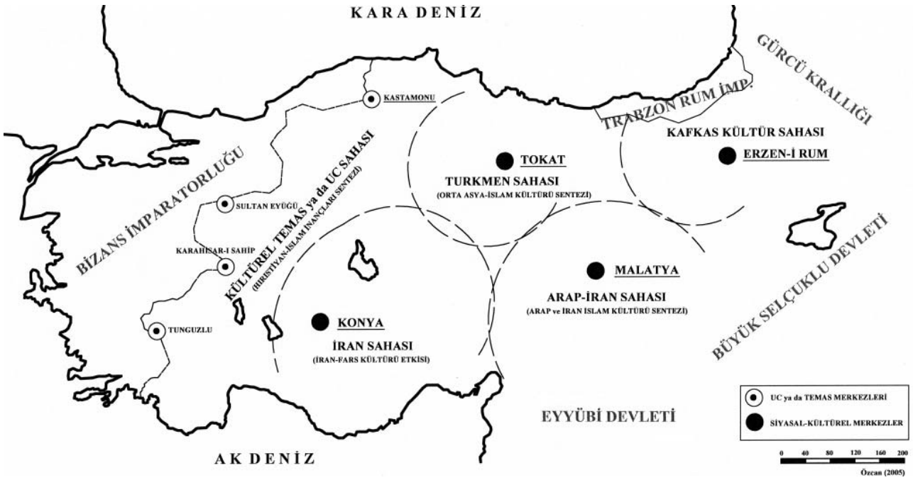
Harita 5. Anadolu'da Selçuklu dönemi yerleşim sürecinin mekansal çözümlemesi.