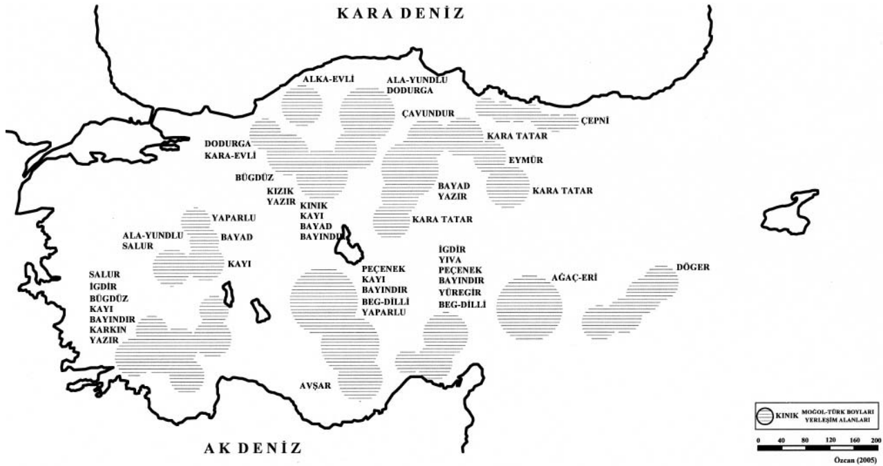
Harita 9. Anadolu'da Selçuklu dönemi Türk-Moğol boyları dağılım coğrafyası.

Burada kentler sistemi açısından dikkat çekici nokta; yaylak-kışlak alanlarının yerleşme işlevinin ötesinde savaş dönemlerinde orduların toplanma ya da konaklama işlevine hizmet etmesidir. Bu çerçevede dönemin tarihi kaynaklarından; Selçuklu ve İlhanlı tabiiyet dönemlerinde Aksaray yakınlarındaki Kılıç Aslan Ribâtı çevresi, Kızılırmak ve Yeşilirmak havzalarındaki Kırşehir, Delice ve Niksar yöreleri ile Erzincan-Sivas arasındaki Karanbük yöresinin kışlak, Yabanlu Bâzarî ve Erzincan yörelerinin ise yaylak olarak kullanıldığı anlaşılmaktadır (Aksarayî, 1943, 137, 187, 190-191, 254-255, 340; Aksarayî, 2000, 33, 83, 86-87, 153, 155, 232, 250-251).