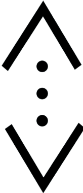
Resim 2. Çukur'da yaşayan mahalle sakinlerinin aidiyetini simgeleyen dövme

İşaretleme geleneğinin tarihsel geçmişinde mahkûmların bedenlerine, hükümdarın damgasının basılarak iktidarın sonuçlarının dövme halinde işlenmesi, böylece yönetene ait bir nesneye dönüştürülme (Foucault, 1977) amacı taşımaya yer almaktadır. Ancak Çukur temsilinde bireyin çukura ait bir nesneye dönüşmeyi kendi rızasıyla taahhüt etmesi söz konusudur. Nitekim bu durum bireylerin görünür kılınarak gözetim yoluyla denetlenebilirliklerini arttırmaktadır (Bauman, 1996). Çukur temsilinde ise dövme bir iç-denetim mekanizması olarak çalışmakta işareti taşıyan bireylerin birbirlerini tanımlarına ve bu sayede ortak hareket etmelerine olanak sağlamaktadır. Bu durum neticesinde: "Çukur'daki ortak çıkarlar da, mahallelinin öncelikli (etnik, cinsi, dini vs.) bütün kimliklerini aşan bir 'Çukurlu' kimliği yaratmıştır" (Aymaz, 2019, 1002) ve bu kimlik mekânsaldır. Bireyin hem mahalleye hem yakın çevresine hem de ailesine bu bağlamda duyduğu sorumluluk Çukur simülasyonunu mekânsal anlamda kutsallaştırmakta, sembolizm aracılığı ile politik bir iklime teslim etmektedir. Çukur'lu olmanın getirisi olarak temsil edilen ortak normların oluşturduğu kültürel uygulamaların çoğu, ritüel ve törenler aracılığıyla