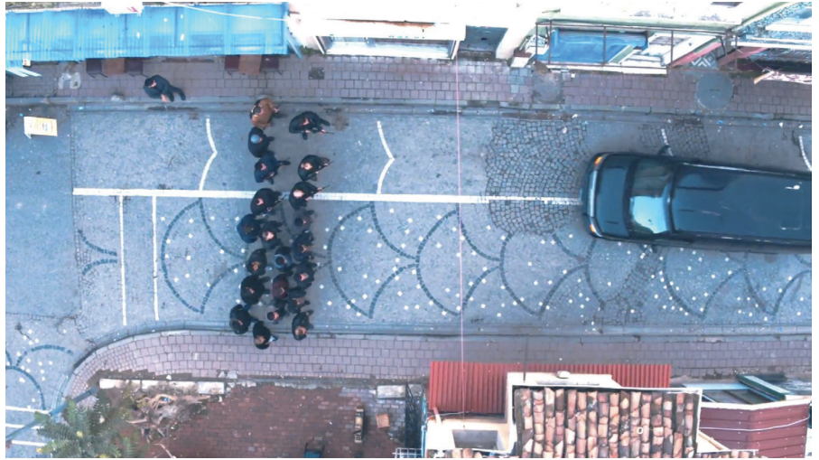
Resim 1. Mutlakiyetin mahalle içindeki en üst seviye temsili; kahvehane mekânı ve önündeki kamusal sokak (Çukur, 2017-2021)

Çukur'da temsil edilen kahvehane mekânı, mahalledeki kamuoyu nezdinde oluşan otoritenin tesisinin örgütlenebildiği bir yönetim alanı tanımlamaktadır. İktidarın mahallenin mülki sahibi olan Koçovalı ailesinin elinde toplanması ve aile reisinin mahallenin en söz sahibi ve yetkili otoriteyi temsil etmesi, aile içindeki ataerkil hegemonyanın tezahürünü mahalle ölçeğinde tahakküme dönüştürmektedir. Yansıtılan eril tutum, kahvehane mekânını mutlakiyetin mahalle içindeki en üst seviyesine taşımakta aynı zamanda kolektifleştirmektedir. Mahallenin sahibi konumundaki Koçovalı ailesi, kamusal otoriteyi temsil ederken kahvehane mekânını mahalle halkının müşterek sorunlar ve ortak yaşamla ilgili müzakerelerini gerçekleştirdikleri bir meclis gibi araçsallaştırmaktadır. Bu mekân, rolü gereği tüm karar verici yetkiyi kendisinde toplayan bir parlamento gibi hareket etmektedir ve Çukur'un dışında kalan erke karşı örgütlü bir siyasal direnç alanının merkezini oluşturmaktadır. Kahvehane mekânının sahip olduğu hiyerarşik güç aynı zamanda eril düzenin temsiline ilişkin güçlü referanslara sahiptir. Zira kahvehane mekânında gerçekleştirilen her eylem sadece sosyal hayatın deneyimlenmesini ve gündelik pratikleri içermemekte, erkin sürekli eril yollardan test edildiği, belirli ritüellerin gerçekleştirilerek mahalleye ait değer sistemlerinin pekiştirildiği dahası bunun kurumsallaştırıldığı ve kutsandığı bir mekân olarak kurgulanmaktadır.